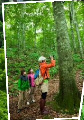
世界遺産の径ブナ林散策道