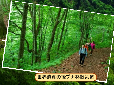
世界遺産の径ブナ林散策道